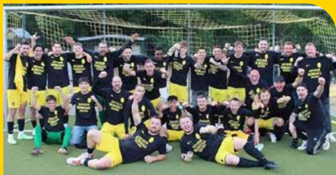
1. Mannschaft und Aufsteiger der Saison 2023/24