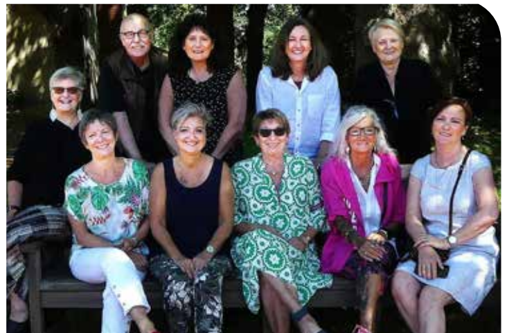
Künstlerinnen und Künstler der Gruppe „Der Blaue Rather“