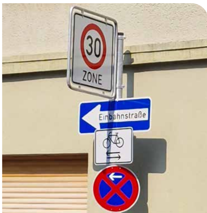
Beschilderung in der Von-Werth-Straße (Fahrradfahren in Gegenrichtung zum übrigen Verkehr erlaubt.)