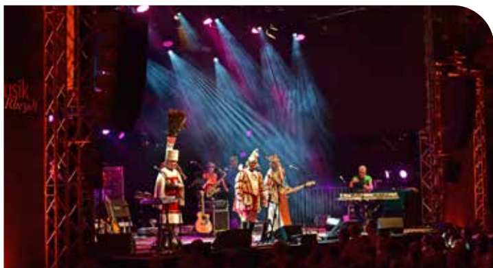
Die Band Köbes Underground bei einem ihrer Auftritte

Vom 23. August bis zum 1. September findet im Schloss Rheydt wieder die diesjährige SommerMusik statt. Zur Eröffnung des Festivals spielt Gregor Meyle mit seiner großartigen Band. Leider sind die Karten für das Konzert bereits ausverkauft. Gleiches gilt auch für das Gastspiel der Dire-Straits-Musiker. Und wer die Tribute Show Night Fever mit den Hits der Bee Gees erleben möchte, sollte sich beeilen. Aktuell sind nur noch wenige Restkarten im Vorverkauf zu haben. Der besondere Charme der SommerMusik-