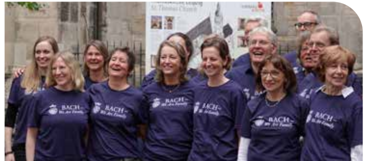
Mitglieder des Mönchengladbacher BachChores vor der Thomaskirche in den diesjährigen Chorshirts

Alljährlich findet in Leipzig, der Stadt in der Johann Sebastian Bach viele Jahre lebte, wirkte und starb, ein großes Bachfest statt. Das stand diesmal unter dem Motto „CHORal Total“. Für die in der Leipziger Thomaskirche am 14. Juni geplante Motette hatte ein israelisches Ensemble absagen müssen und so erhielten die Mönchengladbacher nach Absprache die Möglichkeit, dessen A cappella-Part zu übernehmen. Für die Fahrt nach Sachsen (520 km) wurde