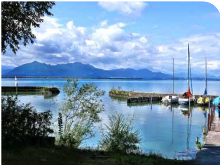
Am Ostufer des Chiemsees (Bayern)

Das nächste Heft von Unser Odenkirchen erscheint am 09. August 2024. Wir wünschen Ihnen allen einen schönen Urlaub, gute Reise und erholsame Tage!