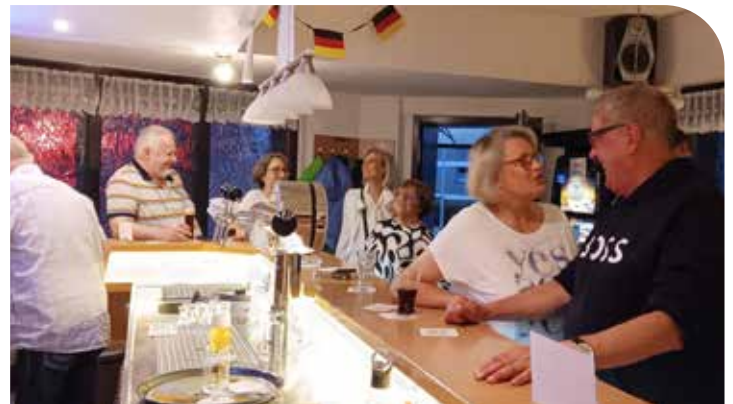
Teilnehmerinnen und Teilnehmer des Treffens der ehemaligen 9a im Wiedemann-Eck

Ein Klassentreffen der besonderen Art fand Mitte Juni im Wiedemann-Eck in Odenkirchen statt. Die ehemaligen Schüler der Wiedemann Gemeinschafts-Schule hatten sich getroffen, um ihren 50-jährigen Schulabschluss zu feiern. 22 der einst 32 Klassenkameraden und -kameradinnen waren gekommen. Auch zwei frühere Lehrer hatten es sich nicht nehmen lassen, dabei zu sein. Gemein-