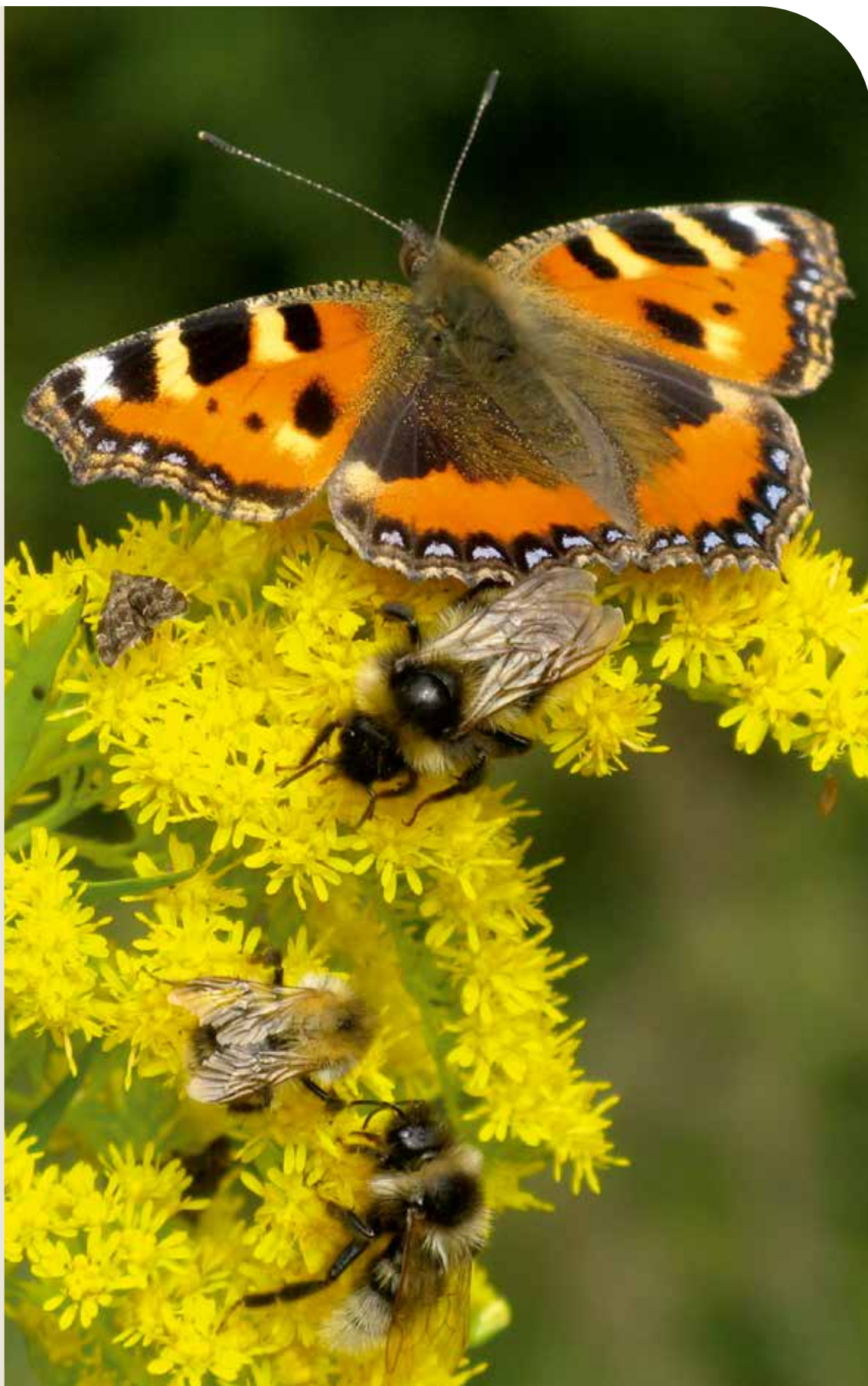
Auf der Suche nach Blütennektar

Ausgabe 796 | JAHRGANG 33 | 12. Juni 2024