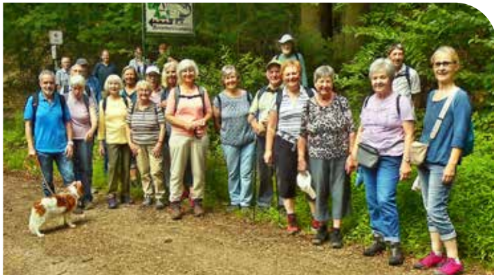
Teilnehmerinnen und Teilnehmer der AWO/DRK-Wandergruppe bei ihrer Tackenbergerrunde

Am dritten Juli-Sonntag waren wieder dreiundzwanzig Mitglieder der AWO/DRK-Wandergruppe zu einer Tour durch den Elmpter Schwalmbruch zusammengekommen. Auf schön angelegten Wegen mit nur wenigen leichten Steigungen ging es schon bald über niederländisches Gebiet. Im Bereich der Schwalm wurde der Weg dann durchaus uriger. Hier war durch enges Gehölz die Fortbewegung im Gänsemarsch angesagt. Daneben mussten auch einige sumpfige Abschnitte über Bretterstege überquert werden.