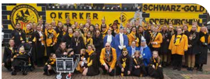
Die Gladbacher Prinzenpaare im Kreis der Karnevalsfreunde Schwarz-Gold Odenkirchen beim Veedelszoch 2024

Einen tollen Start in die fünfte Jahreszeit plant die KG SGO für den 23. November ebenfalls in der Odenkirchener Burggrafenhalle. Ein Abend voller Tanz, Humor und karnevalistischer Tradition wartet auf die Besucherinnen und Besucher. Neben mitreißenden neuen Darbietungen der einzelnen Tanzgarden werden des Weiteren der diesjährige Sessionsorden sowie die neuen Ehrensensoren vorgestellt. Natürlich darf auch das Erwachen des Hoppepitzes nicht fehlen. Nach seinem langen Schlaf wird er mit scharfem Verstand und einer guten Prise Humor die Ereignisse des letzten Jahres kommentieren.