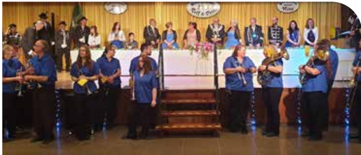
Das Königshaus der Geistenbecker St. Josef Schützenbruderschaft auf der Bühne der Burggrafenhalle anlässlich des Krönungsballes, im Vordergrund Teile der Show-Trompeten Odenkirchen