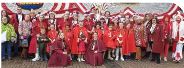
Mitglieder der Karnevalsgesellschaft Ruet-Wiss Okerke vor dem Karnevalswagen beim Veedelszoch 2024